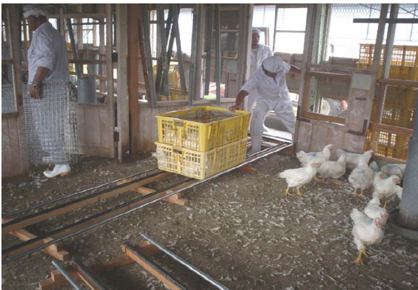
写真1 移送レールを用いた 鶏の搬送作業風景