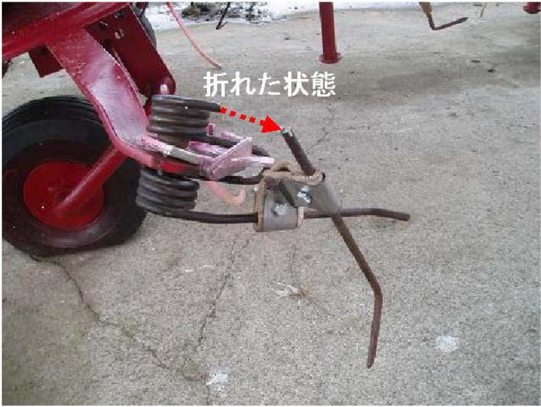
写真2 タイヤが折れても脱落しない様子