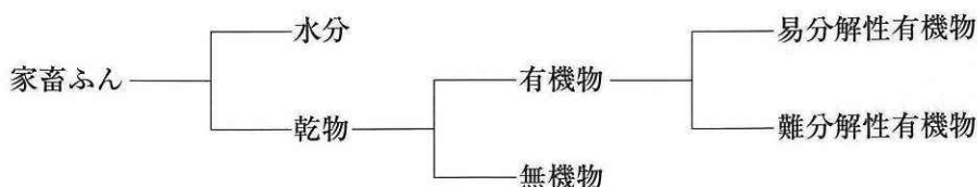
図2 家畜ふんの構成