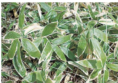
<春先のクマイザサ>

また、栄養価的にはミヤコザサやクマイザサは、牧草より有機成分、無機成分ともに劣り、タンパク質、粗脂肪含量が低く、粗繊維含量が高いとされています。乾物中のTDN含量は新葉で40～70%程度、2年葉で30～35%程度でクマイザサのほうがやや高く、逆にDCPではミヤコザサが新葉で10～12%、2年葉で8%程度に対し、クマイザサは新葉で6～9%、2年葉で5%程度と低くなっています。（外国種肉用牛飼養の手引（H4. 3）(社)全国肉用牛協会）。