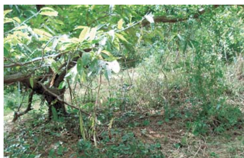
<クリの木の直下は日光が差し込まず草の伸びが悪い>

放牧頭数は、60~70aに2頭を目安として考えます。導入した牧草が定着すると、同面積で初夏~秋は3~4頭、冬季放牧利用の場合はイタリアンライグラスを秋播することにより、2~3頭の飼養が可能になります。