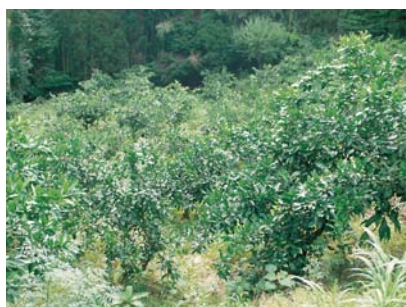
<葉が茂っているみかんの木>