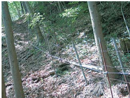
<山林放牧地における電気牧柵>

放牧が水質保全面及び林地保全の面からも適当であるといえます。適正頭数による山林放牧は、糞尿が微生物等による有機物分解及び土壌の浸透ろ過によって浄化され、水質汚染などの環境問題が生じることはないと言われています。しかし、放牧密度を上げた放牧を行うと、環境問題に加え、下草の食べ過ぎなどによる林地の浸食が発生する恐れがあります。