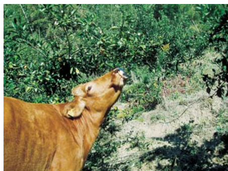
<みかんの葉を食べる放牧牛>

放牧頭数は、60~70aに2頭を目安として考えます。みかんの木や入り込んだ雑灌木はササが食べ尽くされ、導入した牧草が定着すると、同面積で初夏~秋は3~4頭、冬季放牧利用の場合はイタリアンライグラスを秋播することにより、2~3頭の飼養が可能になります。