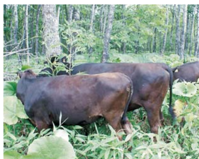
<林地内のササ類を食する繁殖牛>