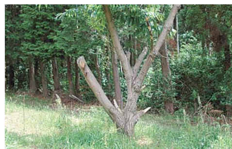
<枝を落として日光が入るようにしたことにより、草が良好に生育>