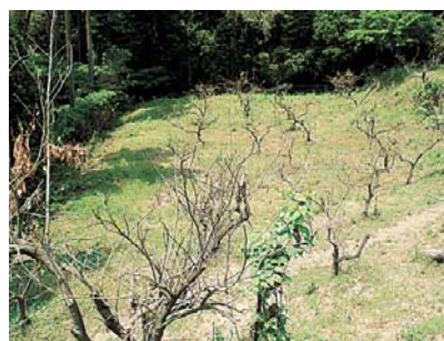
<葉を食べられ枯れたみかんの木>