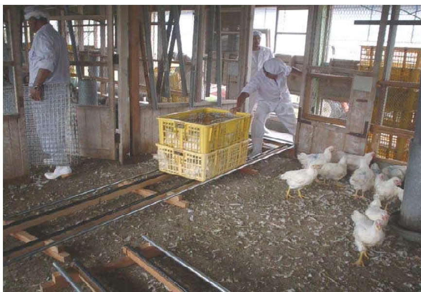
写真1 移送レールを用いた 鶏の搬送作業風景