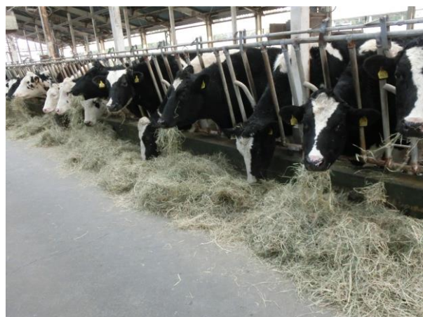
トールフェスク2番乾草給与時の様子