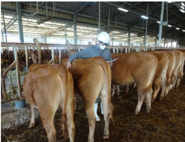
(繁殖牛管理に関する実習の様子)

詳しくはHPをご覧ください http://www.nlbc.go.jp/saiyo/internship/index.html