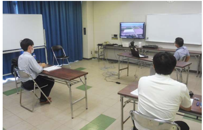
(飼料作物種子増殖業務の説明の様子)