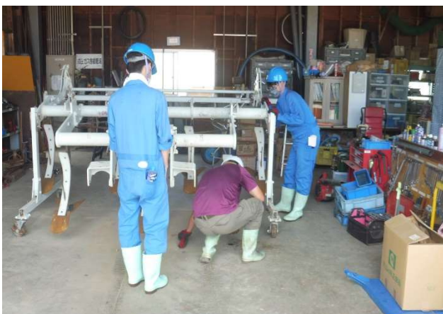
(農機具整備作業実習の様子)