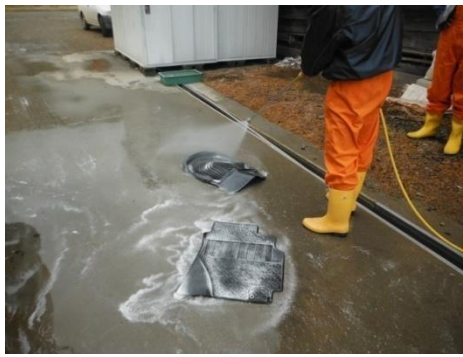
<フロアマットの消毒>