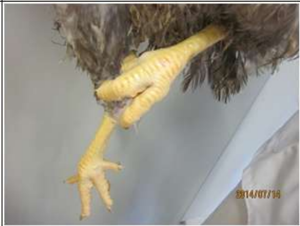
(図3-2) CM♂ (88×981♂) 羽色タイプⅡの羽色・外貌の特徴