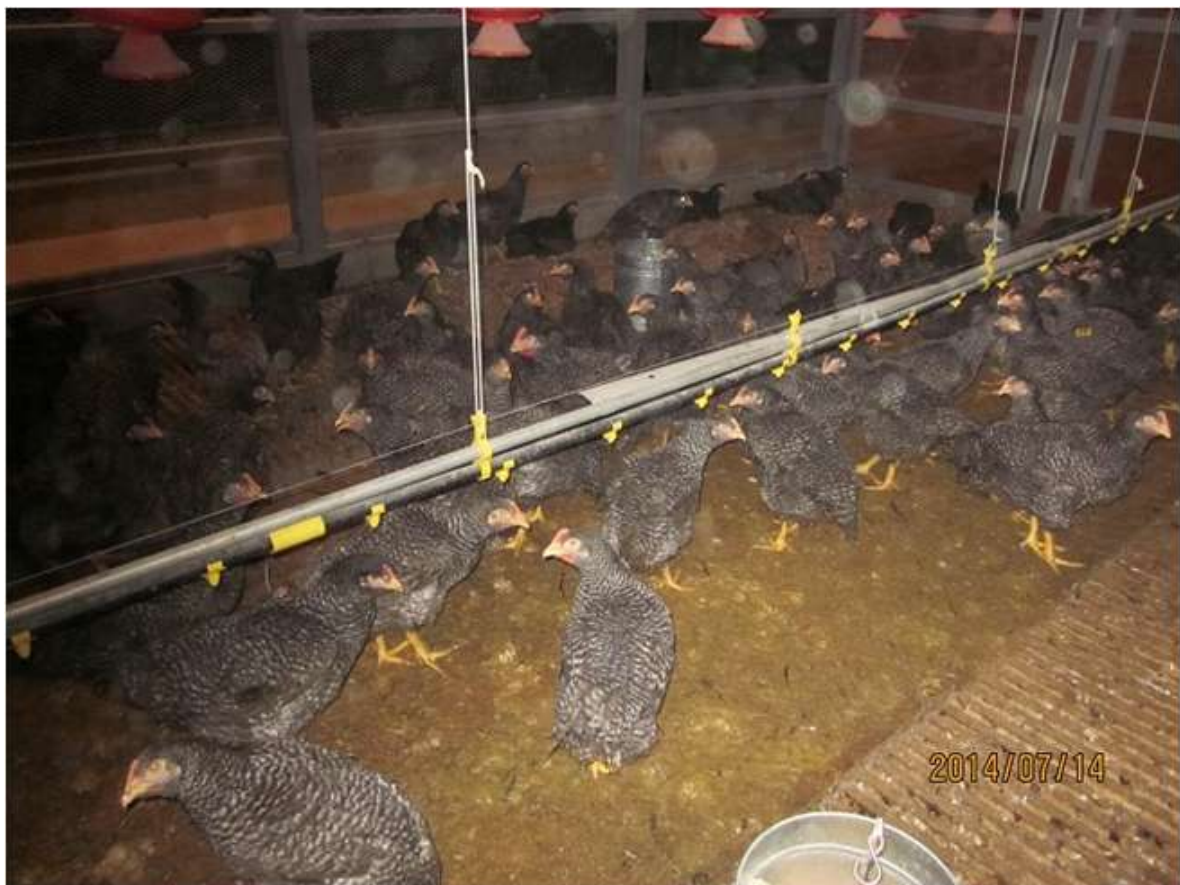
(図4-4) CM♀ (88×981♀) の飼養状況