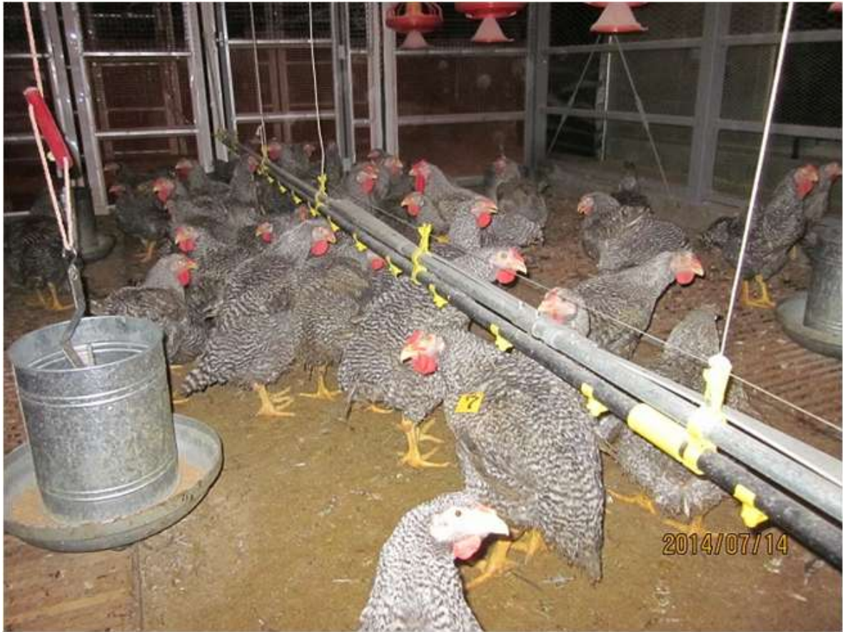
(図 3 - 4) CM♂ (88×981♂) の飼養状況