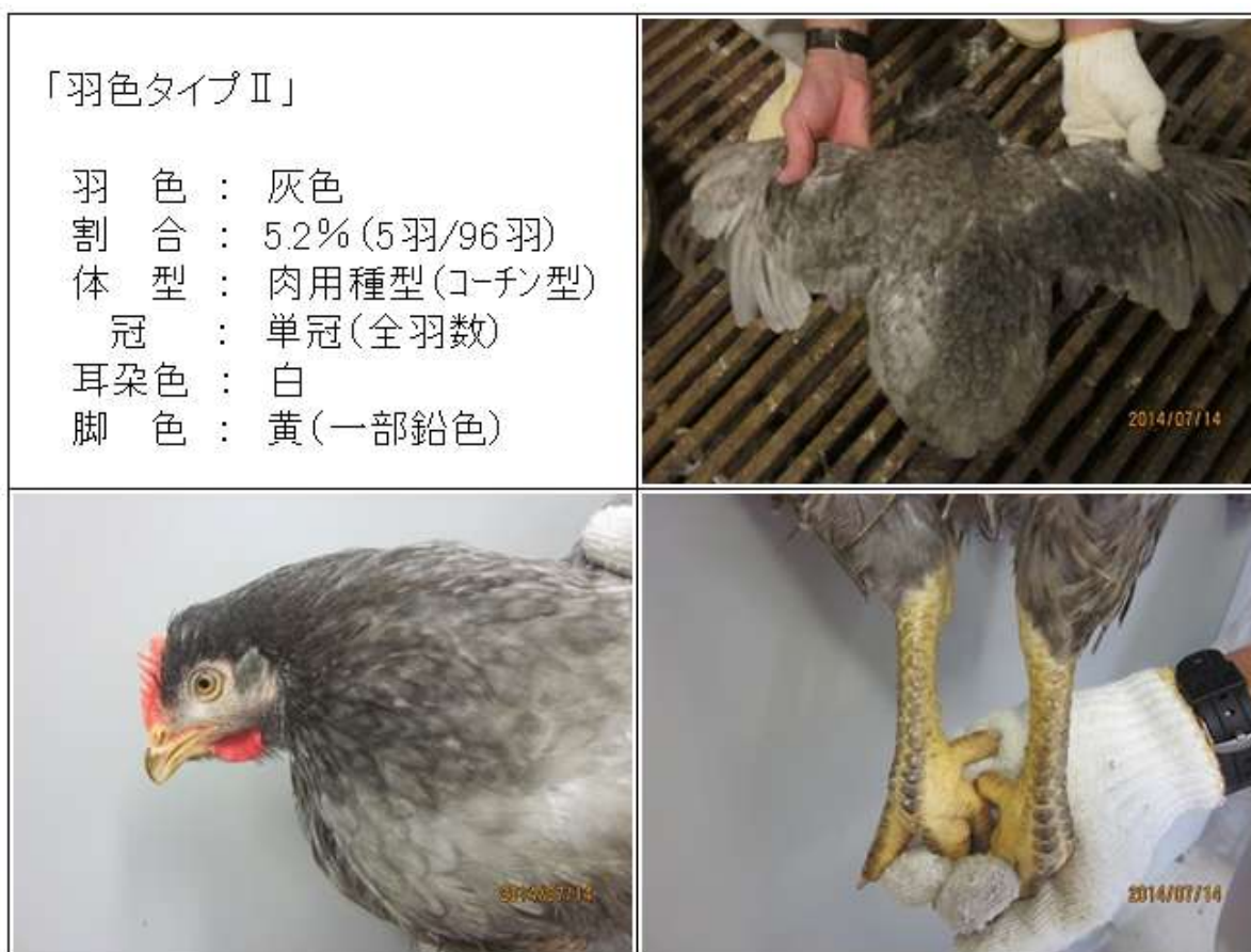
(図4-2) CM♀ (88×981♀) 羽色タイプⅡの羽色・外貌の特徴