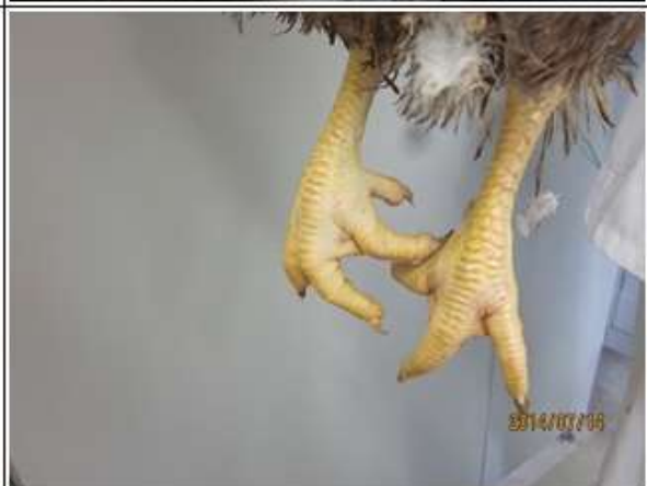
(図3-3) CM♂ (88×981♂) 羽色タイプⅢの羽色・外貌の特徴