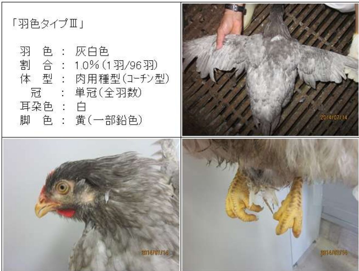
(図4-3) CM♀ (88×981♀) 羽色タイプⅢの羽色・外貌の特徴