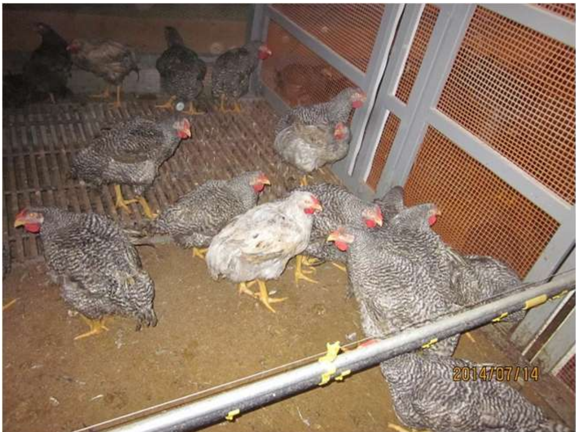
(図 3 - 5) CM♂ (88×981♂) の飼養状況 (羽色の比較)