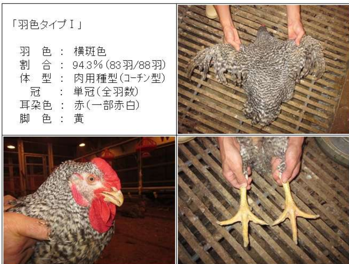
(図3-1) CM♂ (88×981♂) 羽色タイプⅠの羽色・外貌の特徴