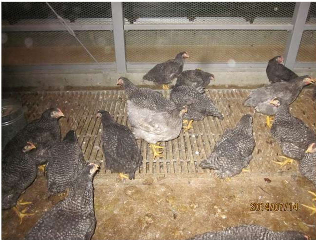
(図4-5) CM♀ (88×981♀) の飼養状況 (羽色の比較)