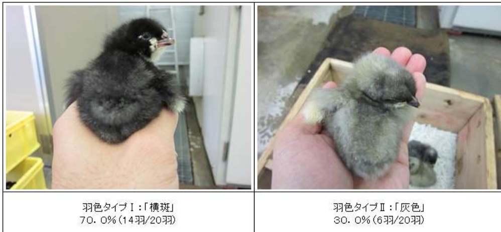
(図2-2) CM♀ (88×981♀) の羽色