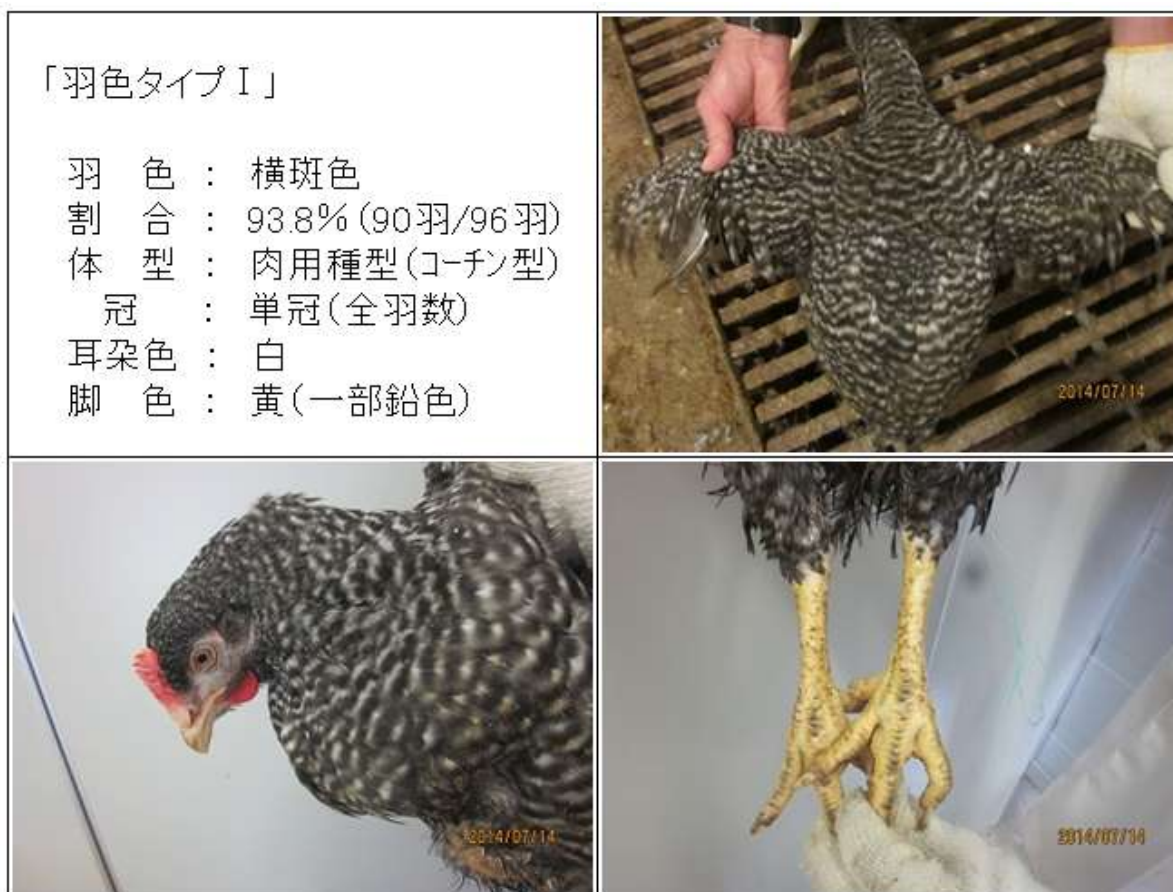
(図4-1) CM♀ (88×981♀) 羽色タイプⅠの羽色・外貌の特徴