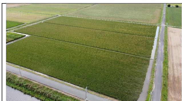
つきあやか(中生)(令和3年度の様子)

生産ほ場および展示ほの見学を随時受け付けておりますので、ご希望の方は下記までご連絡下さい。