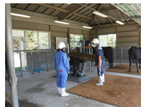
(種雄牛の精液採取業務説明の様子)