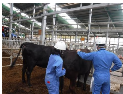
(分娩牛管理の様子)