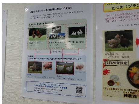
食堂内の展示ポスター（左：「たつの」はどうしておいしいの？、右：兵庫牧場に由来する畜産物）