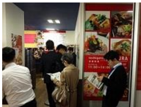
フェアメニュー「純和鶏鉄板焼御膳（税込み 1,200 円）」と「咲くら」の店内の様子（右）