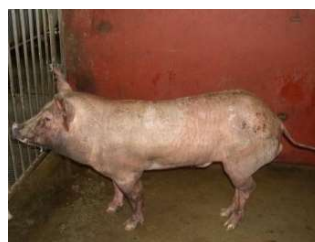
メキシカンヘアレスピッグ