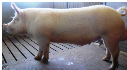
大ヨークシャー種