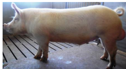
大ヨークシャー種