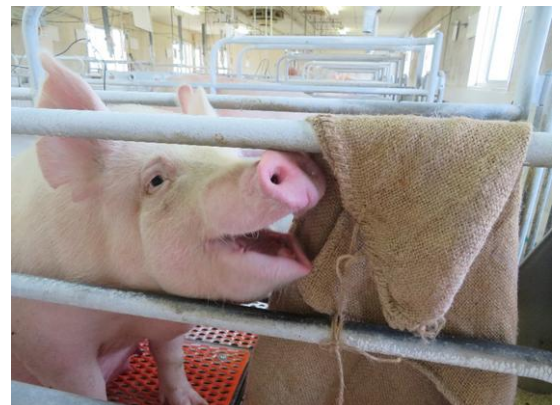
アニマルウェルフェアに配慮した飼養管理

母豚に巣材として麻袋を提供することで、分娩時のストレスが減ることを明らかにしました。