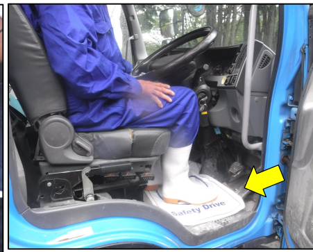
<使い捨てフロアマットの使用>

来場者記録票の記入・専用着への更衣・車両消毒が終わったら、 車両で移動してもらいます