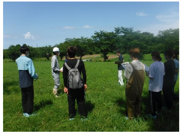
オーチャードグラスの新品種の紹介

昨年の10月に播種したイタリアンライグラスの新品種の展示ほ場の見学のほか、来年に販売が予定され越夏性が改良されたオーチャードグラスの新品種の紹介等を行いました。